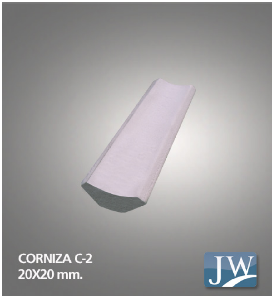
CORNISA C-2 20X20 mm.

Para mayor información contáctese con su ejecutivo de ventas.